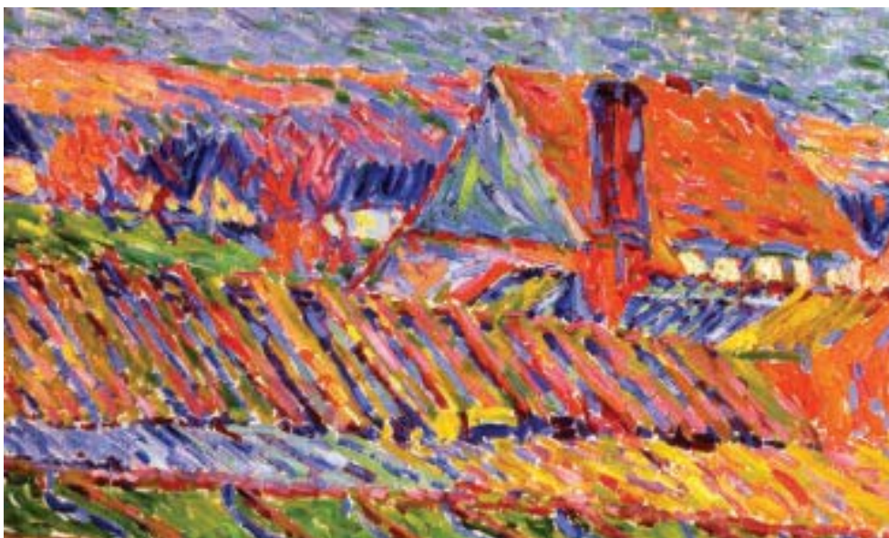
Karl Schmidt-Rottluff, Gärerei, 1906 Brücke-Museum Berlin © VG Bild-Kunst, Bonn