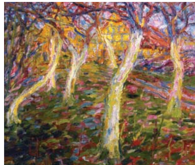
Emil Nolde, Weiße Stämme , 1908 Brücke-Museum Berlin