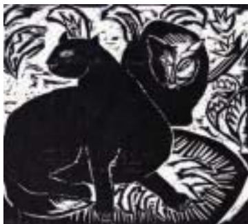
Karl Schmidt-Rottluff, Oberhäuserbruch , 1910 Brücke-Museum Berlin © VG Bild-Kunst, Bonn Karl Schmidt-Rottluff, Katzen II , 1914 Brücke-Museum Berlin © VG Bild-Kunst, Bonn