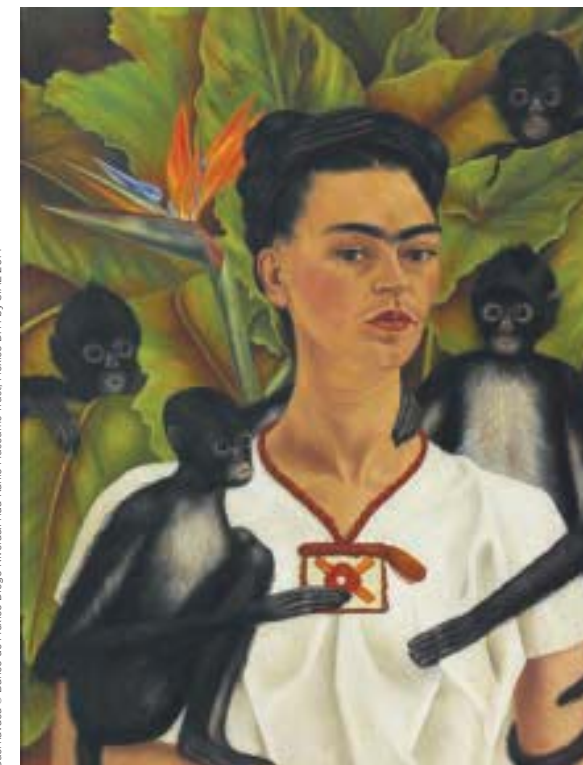
Frida Kahlo, Autoritratto con scimmie, 1943. The Jacques and Natasha Gelman Collection of 20th Century Mexican Art and The Vergel Foundation, Cuernavaca