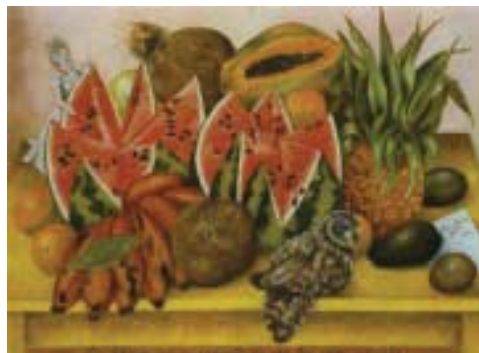
Frida Kahlo, La sposa che si spaventa vedendo la vita aperta, 1943. The Jacques and Natasha Gelman Collection of 20th Century Mexican Art and The Vergel Foundation, Cuernavaca

Scuola infanzia, primaria e secondaria di I grado