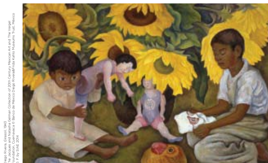
Diego Rivera. Gresoli, 1943. The Jacques and Natasha Gelman Collection of 20th Century Mexican Art and The Vergel Foundation. Cuernavaca.

Seminario di tre incontri da 2 ore ciascuno. A pagamento, su prenotazione a didattica@palazzoducale.genova.it o al numero 010 8171646