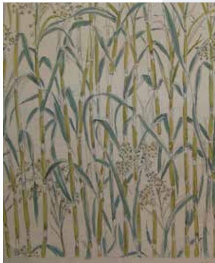
Oscar Saccorotti, Cammino. Bozzetto per tessuto, 1963. Archivio MTA-Nervi di M.A. Palazzoducale-Palazzo Ducale-Fondazione per la Cultura

Scuola primaria e secondaria di I e II grado