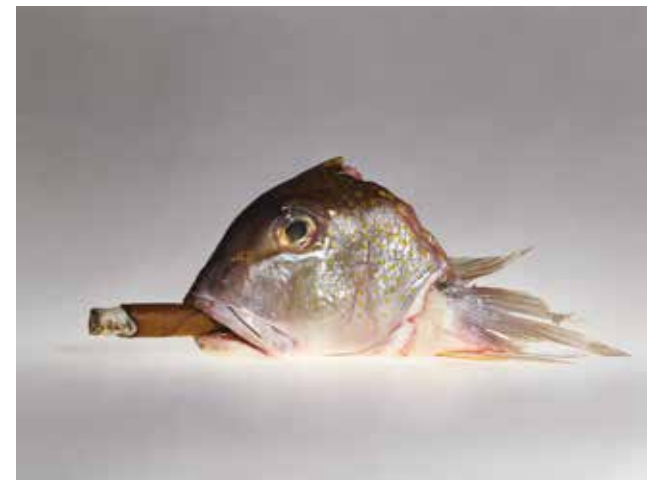
Corbice Cigar with Smoking Fish. © André S. Solidor (aka Elliott Erwitt)